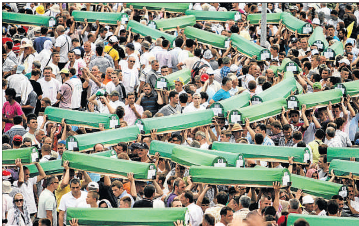
16 años y 6.598 cadáveres. Féretros de algunas víctimas de la masacre de Srebrenica (1995) enterradas ayer en el memorial de la masacre de Potocari, en Bosnia-Herzegovina